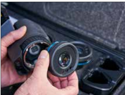
Сменные объективы (от широкоугольных до телеобъективов) для всего «парка» камер за счет применения оптики AutoCal™