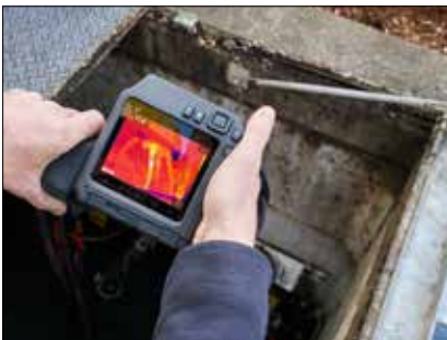
Поворотный (на 180°) оптический блок и яркий 4-дюймовый ЖК-экран обеспечивают удобство пользования камерами серии T500 в любых условиях